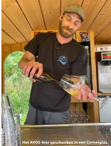
Het AVOS-bier geschonken in een Cornetglas.