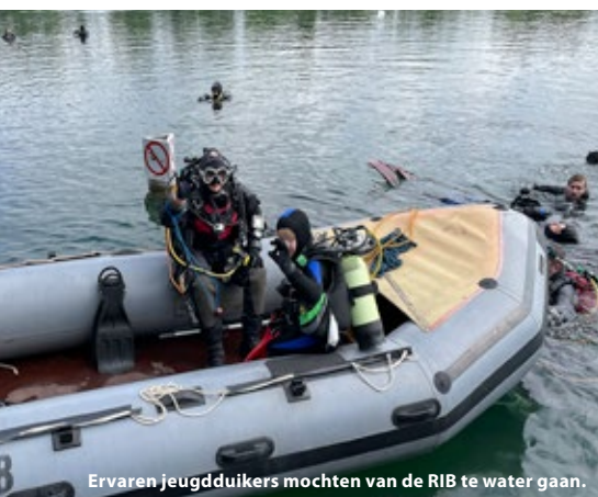
Ervaren jeugddivers mochten van de RIB te water gaan.