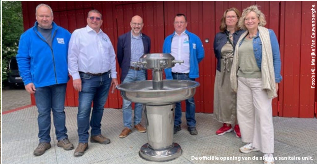
De officiële opening van de nieuwe sanitaire unit.