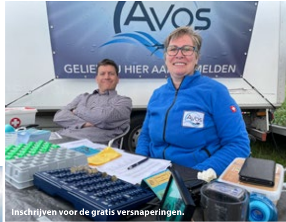
Inschrijven voor de gratis versnaperingen.