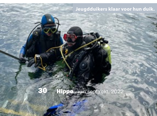
Jeugddivers klaar voor hun duik.

AVOS bestaat 50 jaar en mag zich sinds 2 februari 2022 een 'Koninklijke Maatschappij' noemen. Bovendien werd de bouw van de sanitaire unit aan de put van Ekeren eindelijk afgerond. Redenen genoeg voor een feestje!