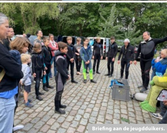
Briefing aan de jeugddivers.