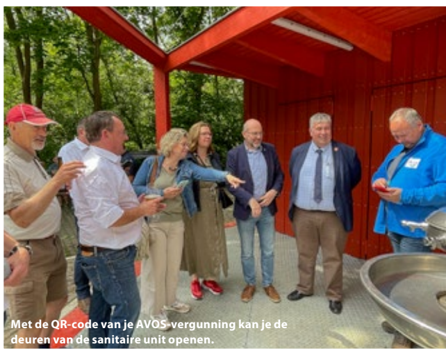
Met de QR-code van je AVOS-vergunning kan je de deuren van de sanitaire unit openen.