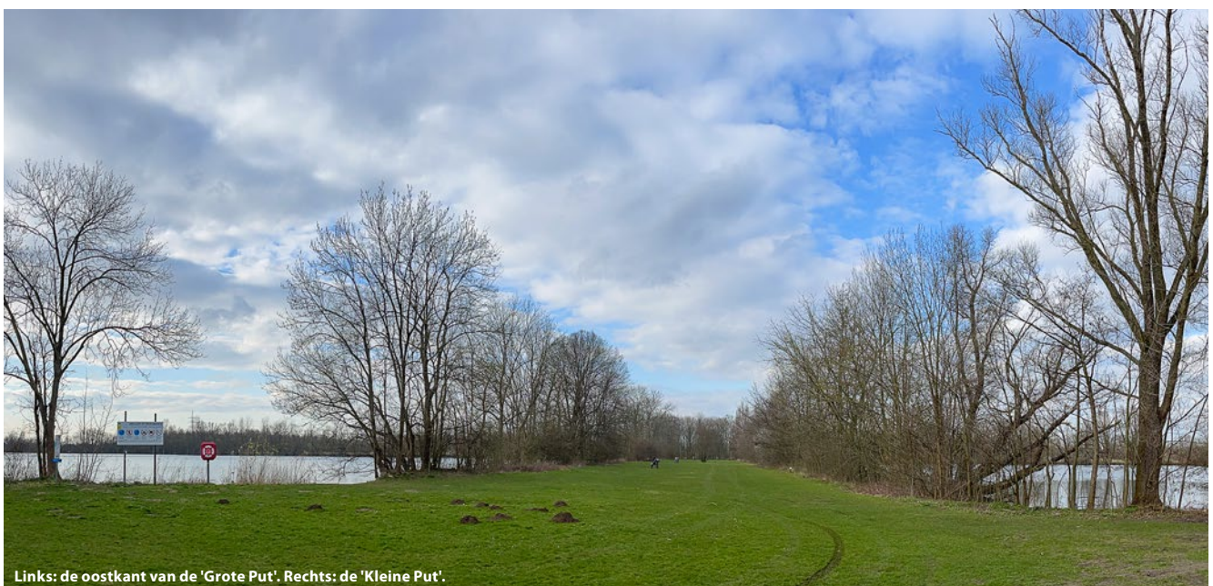
Links: de oostkant van de 'Grote Put'. Rechts: de 'Kleine Put'.