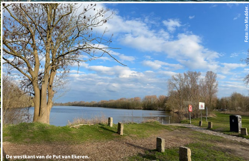
De westkant van de Put van Ekeren.