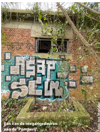
Eén van de toegangsdeuren van de 'Pomperij'.