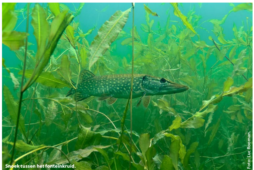
Snoek tussen het fonteinkruid.

Elders vind je hoge stengels met langgestrekte bladeren. Dat is fonteinkruid. Waar het blad aan de stengel vastzit, draait het rond die stengel: de bladvoet is stengelomvattend. Op die plaats zit slechts één blad. Het volgende blad zit wat hoger en wijst naar een andere richting, het volgende weer