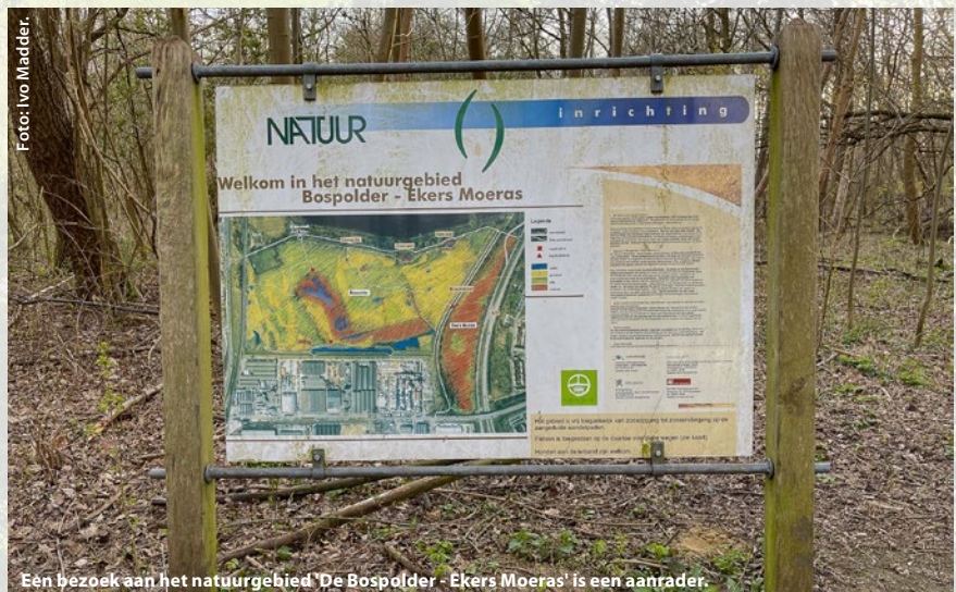
Een bezoek aan het natuurgebied 'De Bospolder - Ekers Moeras' is een aanrader.

Op de Ferrariskaart van 1777 zie je een stuk land met ongeveer de contouren van de 'Put van Ekeren'. Erboven staat 'Polder de Muysbroeck' en onderaan zie je de 'Eekerschen Dijk' en het riviertje 'Schoon Schijn'. Aan de zuidzijde van de 'Ekerse dijk' liggen enkele kleine waterplassen: 'De welen van de Bospolder' en er is geen 'Put' te zien. Ook op een kaart uit 1903 is nog steeds geen 'Put van Ekeren' te zien.