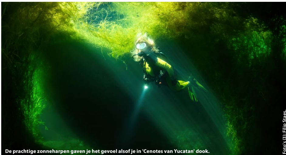
De prachtige zonneharpen gaven je het gevoel alsof je in 'Cenotes van Yucatan' dook.