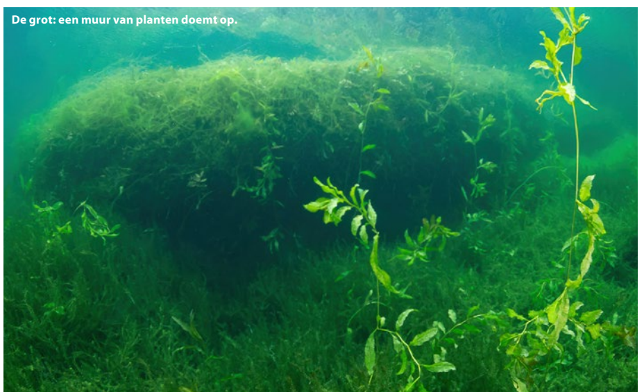
De grot: een muur van planten doemt op.