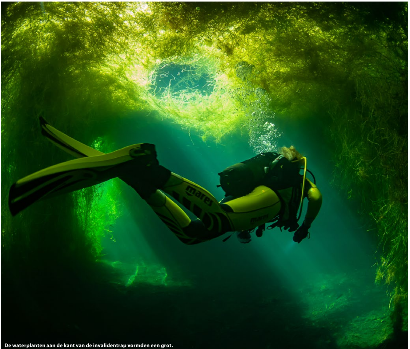
De waterplanten aan de kant van de invalidentrap vormden een grot.