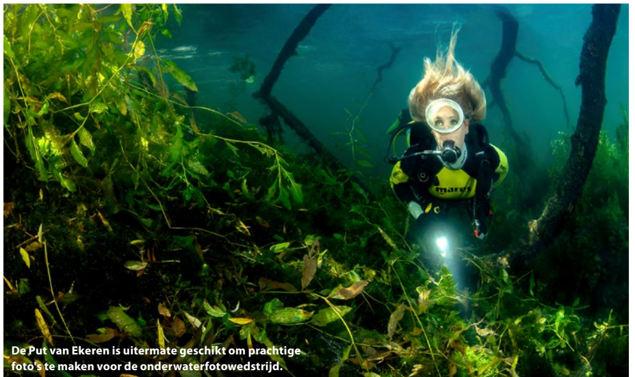
De Put van Ekeren is uitermate geschikt om prachtige foto's te maken voor de onderwaterfotowedstrijd.