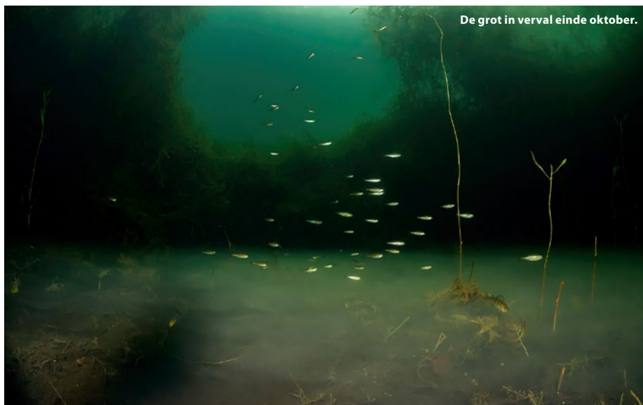
De grot in verval einde oktober.

Filip Staes is geen onbekende in de onderwaterfotografie wereld ( www.fsfotografie.be ). Hij behaalde de afgelopen twintig jaar vele podiumplaatsen tot ver over de grenzen heen. In 2020 richtte hij zijn eigen onderwaterfotografie-academie op waar je onder andere workshops, themaduiken, groepsreizen en individuele opleidingen van starter tot gevorderde fotograaf kan volgen. Op www.o-f-a.be vind je daarover meer info.