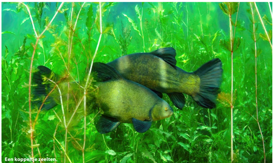
Een koppeltje zeelten.